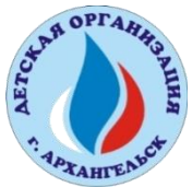
Схема взаимодействия Детской организации «Юность Архангельска»