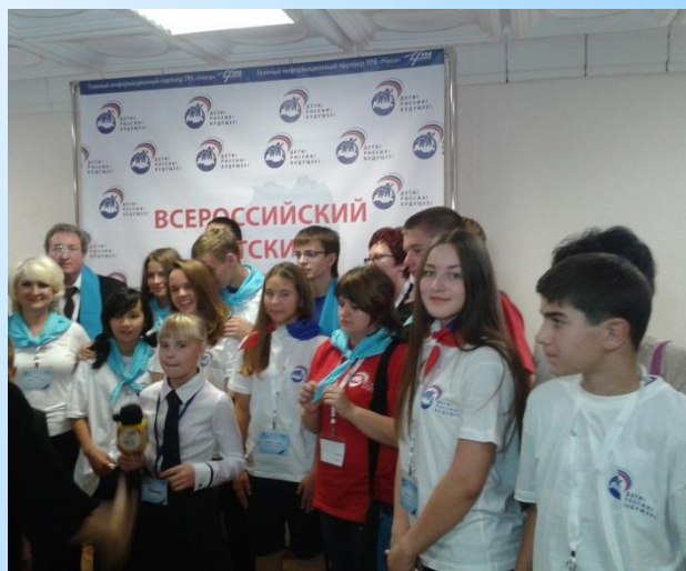
Форум «Дети! Россия! Будущее!» в г. Калуга